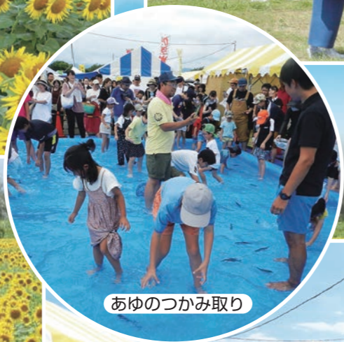
あゆのつかみ取り