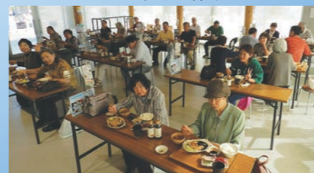
道の駅にてランチタイム