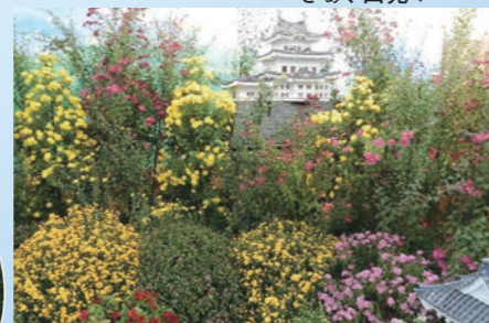
小田原城の菊花展