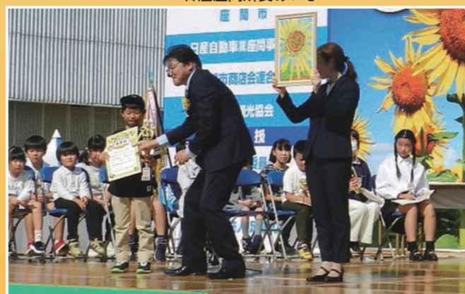
写生コンテスト表彰