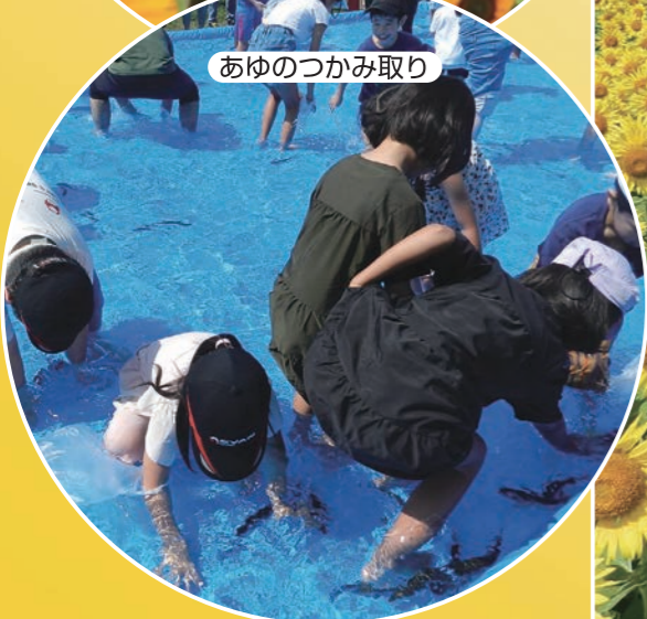
あゆのつかみ取り