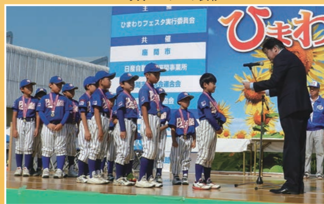
ジュニア野球大会表彰