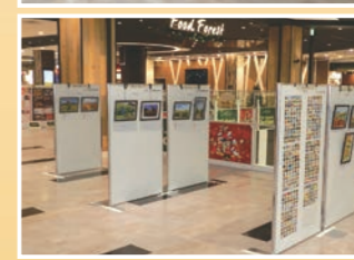
展示会 於: イオンモール座間

ひまわりフェスタでは、観光協会主催の「ひまわり写真コンテスト」やひまわりフェスタ実行委員会主催の「ひまわり写生コンテスト」の入賞者、「0462.net杯争奪ジュニア野球大会」の優勝チームへの表彰式が行われ、満面の笑みでの授賞式となりました。