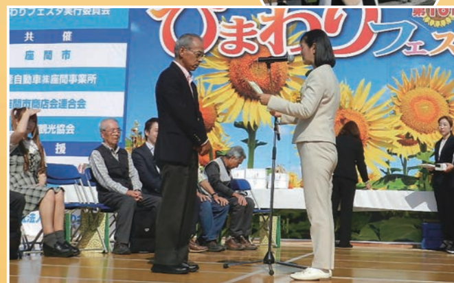
写真コンテスト表彰