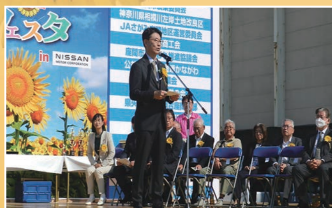
日産座間所長あいさつ