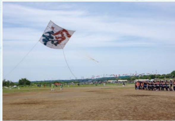
令和元年の大凧揚げ（相模川グラウンド）

昭和57年には、“かながわまつり50選”に選定、平成3年には国の選択無形民俗文化財に指定され、伝統行事・伝統芸能として例年、盛大に開催されています。