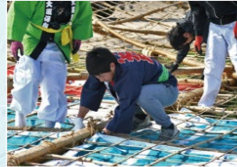
まつり当日。骨組みに紙を貼る様子